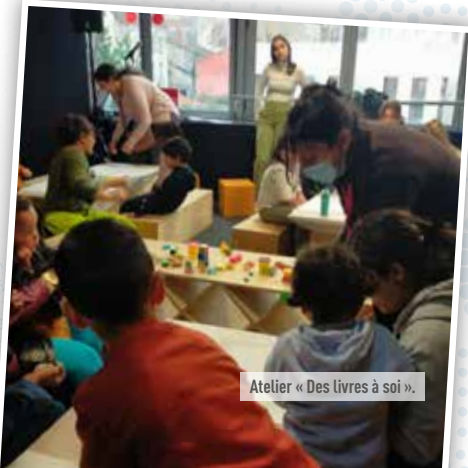
Atelier « Des livres à soi ».

20 familles villeneuvoises participent à cette opération et ce sont 50 parents et enfants de 2 à 9 ans qui se sont rendus au Salon du livre de Montreuil le 3 décembre dernier.